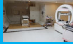
乳がん専用治療室 (GC3)